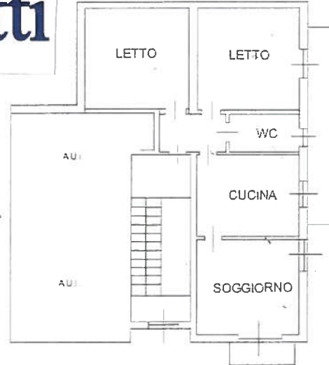
PIANO PRIMO H. 3.00